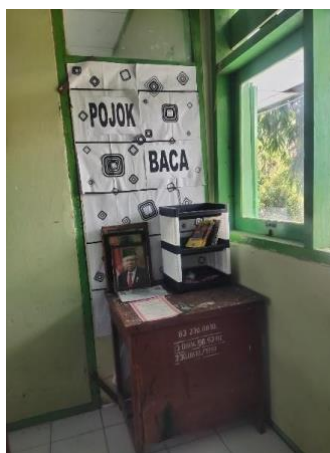
Gambar 1. Pojok Baca SMAN 1 Jiwan

Dalam mensukseskan pojok baca pihak sekolah sudah merencanakan kegiatan membaca selama 15 menit sebelum pembelajaran telah menjadi kebiasaan di seluruh kelas dan dilaksanakan setiap hari Selasa dan Rabu. Program membaca selama 15 menit sebelum pembelajaran dikelas dimulai, sangat membantu dalam peningkatan gerakan literasi membaca di sekolah.