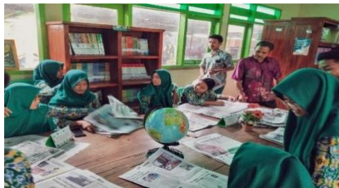
Gambar 2. Siswa melakukan pembiasaan literasi 15 menit

Dalam pelaksanaan di lapangan mereka tampak focus dan serius dalam menyimak isi berita, menunjukkan bahwa kegiatan membaca bukan hanya menjadi kewajiban, tetapi telah menjadi kebiasaan yang menyenangkan. Pada dasarnya Kegiatan Literasi Sekolah atau GLS sangat menunjang Program-program Pengembangan Sekolah, karena dengan literasi siswa lebih terlatih memahami buku atau bacaan yang mereka baca. Program literasi 15 menit ini telah terintegrasi ke dalam rutinitas harian siswa, di mana mereka diajak membaca sebelum pelajaran dimulai untuk melatih kemampuan berpikir kritis, memperkaya kosakata, serta menumbuhkan minat dan budaya baca sejak dini. Kegiatan ini juga berfungsi sebagai momen membangun kedisiplinan dan kebiasaan positif di pagi hari, mengalihkan perhatian siswa dari gawai dan kebisingan, serta mempersiapkan mental mereka untuk menerima pelajaran dengan lebih tenang dan fokus. Pemilihan bahan bacaan berupa koran memberikan manfaat ganda selain melatih kemampuan membaca, siswa juga mendapatkan wawasan aktual tentang peristiwa yang terjadi di dalam dan luar negeri, menumbuhkan rasa ingin tahu, serta membangun kesadaran terhadap isu-isu sosial dan lingkungan.