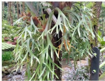
Gambar 6. Platyserium bifurcatum (Cav.) C.Chr.

Nephrolepis exaltata (L.) Schott atau paku pedang dari famili Nephrolepidaceae ditemukan tumbuh epifit pada batang pohon dekat aliran sungai. Hal ini menunjukkan kemampuannya beradaptasi di luar tanah. Spesies ini umum dimanfaatkan sebagai tanaman hias gantung dan berpotensi sebagai obat tradisional untuk berbagai penyakit, seperti batuk, sakit gigi, sinus, penyakit kuning, sakit ginjal, dan gangguan menstruasi (Nikmatullah et al., 2020). Hasil pengamatan menunjukkan paku ini memiliki akar serabut coklat kehitaman, rizom berwarna coklat gelap dengan sisik halus, serta daun majemuk menyirip tunggal berwarna hijau segar dengan anak daun lanset, ujung runcing, dan tepi bergerigi halus.