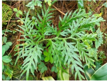
Gambar 10. Selaginella delicatula (Desv. ex Poir.) Alston

terdapat di tepi bawah anak daun, tersebar tidak beraturan, dan terlindungi oleh indusium berbentuk kelopak kecil yang melipat dari tepi daun.