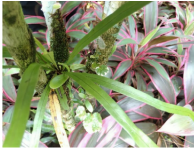
Gambar 1. Asplenium nidus L.

Berdasarkan Tabel 1, hasil identifikasi menunjukkan bahwa di sekitar Air Terjun Srambang Park ditemukan 10 spesies tumbuhan paku yang termasuk dalam 8 famili, yaitu Aspleniaceae, Athyriaceae, Equisetaceae, Lygodiaceae, Nephrolepidaceae, Polypodiaceae, Pteridaceae, dan Selaginellaceae. Dari keseluruhan spesies yang teridentifikasi, sebanyak 6 spesies ditemukan pada habitat terestrial, sedangkan 4 spesies lainnya tumbuh sebagai epifit. Hal ini menunjukkan bahwa kawasan Air Terjun Srambang Park memiliki keanekaragaman tumbuhan paku yang cukup tinggi, dengan distribusi spesies yang menyesuaikan kondisi habitat yang tersedia di lingkungan tersebut.