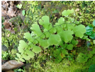
Gambar 8. Adiantum capillus-veneris L.

Pyrrhosia adnascens (Sw.) Ching atau paku lidah tergolong dalam famili Polypodiaceae ditemukan tumbuh epifit menempel pada batang pohon di jalur setapak menuju air terjun. Tumbuhan paku ini berasal dari dataran rendah dan mampu tumbuh di area yang sangat terbuka (Lindasari et al., 2015). Spesies ini memiliki akar serabut berwarna coklat tua hingga kehitaman yang melekat kuat pada inang, serta rizom menjalar berwarna coklat tua berbulu halus. Daunnya sederhana berbentuk lanset memanjang dengan perbedaan ukuran antara daun steril yang lebih pendek dan daun fertil yang lebih panjang (Adjie et al., 2022). Permukaan bawah daun ditutupi bulu halus coklat keemasan dengan sorus tersusun sejajar mengikuti tulang daun lateral.