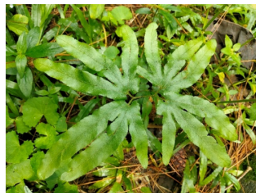
Gambar 4. Lygodium flexuosum (L.) Sw.

Equisetum ramosissimum Desf. dari famili Equisetaceae atau paku ekor kuda merupakan salah satu paku purba yang ditemukan tumbuh terestrial di dekat aliran sungai pada lahan lembap dengan cahaya matahari langsung. Spesies ini dimanfaatkan sebagai obat herbal dan tanaman hias (Renjana, 2021). Akar serabut berwarna coklat kehitaman tumbuh dari pangkal rizom, batang silindris beruas-ruas dengan percabangan halus melingkar, dan nodus berwarna lebih gelap. Daunnya sangat kecil berupa sisik melingkar berwarna hijau pucat hingga keabu-abuan. Ukuran daun-daun tersebut menjadi sangat kecil akibat mengalami reduksi (Fatahillah et al., 2018). Sorusnya tidak terletak pada permukaan daun, melainkan berada di bagian batang fertilnya dalam bentuk strobilus.