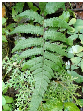
Gambar 2. Deparia petersenii (Kunze) M. Kato

Asplenium nidus L. yang berasal dari famili Aspleniaceae dikenal sebagai paku sarang burung. Tumbuhan ini ditemukan epifit pada batang pohon di sekitar jalan setapak menuju air terjun. Spesies ini sering dimanfaatkan sebagai tanaman hias dan memiliki potensi sebagai obat tradisional untuk mengatasi demam, menghilangkan ketombe, dan menyembuhkan luka (Nikmatullah et al., 2020). Secara morfologi, tumbuhan ini memiliki akar serabut berwarna coklat tua kehitaman, batang berupa rizom pendek yang tertutup pangkal daun, serta daun lanset memanjang membentuk roset dengan permukaan licin mengkilap, dan berwarna hijau muda. Tulang daun utama tampak jelas berwarna coklat kehitaman dan membentang dari pangkal hingga ujung daun (Leki et al., 2022).