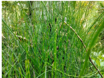
Gambar 3. Equisetum ramosissimum Desf.

bercabang berwarna coklat gelap, batang berupa rizom menjalar dengan sisik coklat, daun majemuk berbentuk lanset berwarna hijau muda, serta sorus yang tersusun sejajar pada permukaan bawah daun.