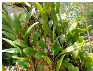
Gambar 7. Pyrrrosia adnascens (Sw.) Ching

Platyserium bifurcatum (Cav.) C.Chr. atau paku tanduk rusa termasuk dalam famili Polypodiaceae yang ditemukan tumbuh epifit pada batang pohon di dekat aliran sungai. Spesies ini dikenal sebagai tanaman hias eksotis dan berpotensi menyerap timbal (Pb) dari udara (Fascavetri et al., 2018). Hasil pengamatan menunjukkan akar serabut coklat tua hingga kehitaman yang melekat kuat pada inang, rizomnya pendek dengan sisik halus berwarna coklat tua dan tersembunyi di antara daun steril yang menempel rapat, serta dua tipe daun, yaitu daun steril yang menempel rapat sebagai pelindung dan penampung humus dan daun fertil yang menjuntai berbentuk menjari menyerupai tanduk rusa dengan sorus pada bagian percabangannya.