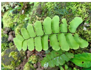
Gambar 9. Adiantum philippense L.

Adiantum capillus-veneris L. atau paku rambut venus dari famili Pteridaceae ditemukan tumbuh terestrial pada area lembap dan teduh di sekitar tebing berair dekat air terjun. Bentuk yang indah membuat paku ini memiliki potensi dimanfaatkan sebagai tanaman hias untuk menambah keindahan lingkungan (Leki et al., 2022). Spesies ini memiliki akar serabut halus berwarna coklat kehitaman, batang berupa rizom menjalar berwarna hitam bersisik, serta daun majemuk bersirip ganda dengan anak daun berbentuk kipas bertepi bergerigi halus. Pada spesies ini nampak sorus di bagian tepi anak daun.