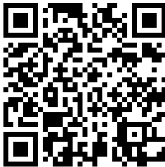
Gambar 2. Barcode Ensiklopedia Digital

Ensiklopedia digital yang disusun disajikan dalam bentuk barcode dan link untuk mempermudah setiap orang mengakses ensiklopedia di berbagai lokasi tempat barcode ini ditemukan. Barcode ensiklopedia digital dapat dilihat pada gambar 2.