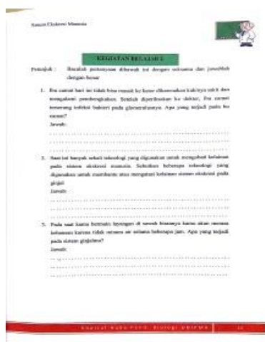
Desain LKS berbasis Literasi Sains berdasarkan persoalan di lingkungan sekitar