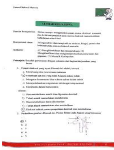
Desain Soal HOTS disusun berdasarkan kategori C4, C5, dan C6