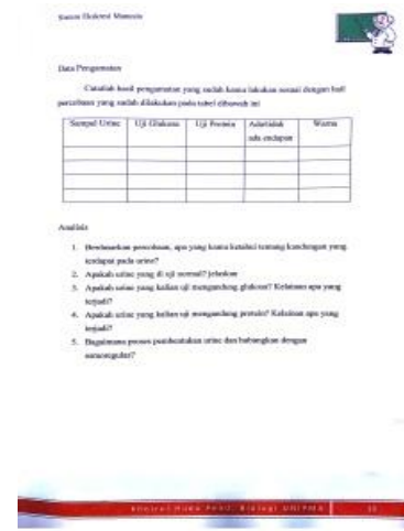
Desain Pengamatan Praktikum dan Soal Analisis