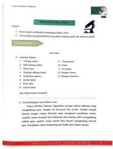
Desain Lembar Kerja Praktikum