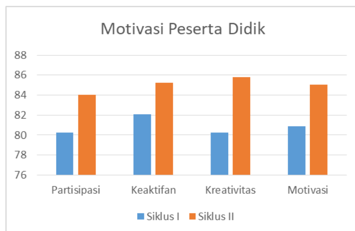
GAMBAR 1. Grafik peningkatan motivasi belajar siklus I, siklus II