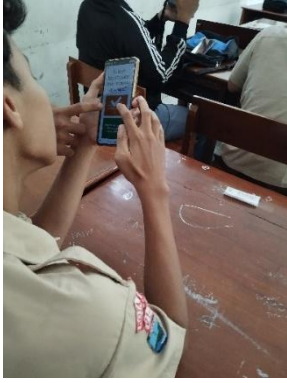
Gambar 3. Evaluasi Menggunakan Wordwall

Evaluasi wordwall dirancang dalam bentuk kuis interaktif yang menilai pemahaman siswa terhadap materi teks ceramah. Guru menyampaikan bahwa penggunaan wordwall efektif dalam mendorong motivasi dan keterlibatan siswa, terutama karena media ini relevan dengan minat serta karakteristik siswa jurusan multimedia. Format evaluasi yang menyerupai permainan ( game ) membuat siswa lebih tertarik, antusias, dan merasa nyaman dalam menjawab soal evaluasi tanpa merasa terbebani. Hasil observasi menunjukkan bahwa sebagian besar siswa menunjukkan partisipasi aktif selama kegiatan berlangsung. Keterlibatan siswa terlihat tidak hanya dalam diskusi dan penulisan teks ceramah, tetapi juga dalam aktivitas presentasi dan evaluasi. Sebanyak 14 siswa masuk kategori aktif, sementara 5 lainnya tergolong kurang aktif. Distribusi tingkat keaktifan siswa disajikan dalam gambar 4 berikut.