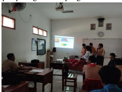
Gambar 1. Pemilihan Topik Ceramah

Pelaksanaan pembelajaran diawali dengan tahapan awal discovery learning , yaitu pemberian rangsangan ( stimulation ). Pada tahap ini, guru menyampaikan penjelasan mengenai materi teks ceramah, contoh teks ceramah, dan contoh video ceramah singkat dengan bantuan power point untuk memperkuat pemahaman siswa. Kegiatan ini bertujuan untuk menumbuhkan rasa ingin tahu dan mempersiapkan siswa sebelum masuk ke tahap identifikasi masalah. Tahap selanjutnya adalah problem statement , yaitu siswa diberikan ruang untuk mengajukan pertanyaan terhadap materi yang belum dipahami. Guru memfasilitasi diskusi yang bersifat eksploratif, memberikan stimulus pertanyaan pemantik, dan menciptakan suasana pembelajaran yang dialogis. Hasil observasi menunjukkan bahwa sebagian besar siswa aktif mengajukan pertanyaan, menandakan bahwa proses berpikir kritis telah terbangun sejak awal kegiatan. Pada tahap pengumpulan data ( data collection ), siswa dibagi menjadi beberapa kelompok yang terdiri dari empat sampai lima orang. Setiap kelompok menentukan topik ceramah yang akan dikembangkan, pemilihan topik dilakukan dengan cara menggunkan spin. Aktivitas ini tampak pada gambar 1 yang mendokumentasikan siswa saat memilih topik secara acak.