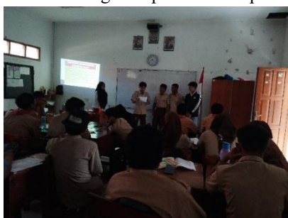
Gambar 2. Presentasi Teks Ceramah

Kegiatan selanjutnya adalah pengolahan data ( data processing ), di mana siswa menyusun teks ceramah berdasarkan topik yang telah mereka pilih. Proses penulisan dilakukan secara kolaboratif dan dituangkan dalam Lembar Kerja Peserta Didik (LKPD). Guru memberikan bimbingan selama proses ini berlangsung, agar siswa dapat mengembangkan struktur ceramah dengan sistematis, sesuai dengan kaidah kebahasaan yang telah dipelajari. Kegiatan ini dirancang untuk menumbuhkan kemampuan berpikir logis, keterampilan menulis, serta kerja sama antaranggota kelompok. Pada tahapan pembuktian ( verification ), masing-masing kelompok mempresentasikan hasil teks ceramah yang telah disusun. Presentasi dilakukan secara bergiliran dan dinilai berdasarkan struktur isi, kaidah kebahasaan, serta ketepatan penggunaan bahasa. Selain menjadi ajang untuk keterampilan public speaking , presentasi ini juga menjadi media validasi pemahaman siswa terhadap materi. Dokumentasi kegiatan presentasi dapat dilihat pada gambar 2.