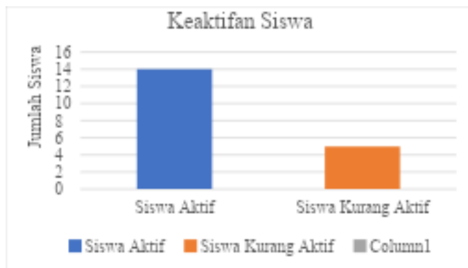
Gambar 4. Keaktifan Siswa

Siswa yang tergolong aktif menunjukkan ciri khas berupa keberanian mengemukakan pendapat, antusias mengikuti diskusi kelompok, serta mampu mempresentasikan hasil kerja secara lugas. Sebaliknya, siswa yang kurang aktif cenderung pasif dalam berdiskusi dan belum sepenuhnya percaya diri saat tampil di depan kelas. Salah satu siswa mengungkapkan bahwa ia masih merasa tidak percaya diri saat harus berbicara di depan umum, meskipun ia memahami materi yang disampaikan. Keberhasilan siswa dalam pembelajaran menulis teks ceramah diukur melalui dua jenis penilaian, yaitu nilai tugas kelompok dan nilai evaluasi akhir yang disajikan melalui media wordwall . Kedua bentuk penilaian ini digunakan untuk mengevaluasi ketercapaian kompetensi siswa, baik dari sisi proses maupun hasil belajar. Penilaian pertama dilakukan melalui tugas menulis teks ceramah yang dikerjakan secara berkelompok. Tugas ini mencakup kemampuan siswa dalam merancang kerangka teks, mengembangkan isi sesuai struktur ceramah, serta menerapkan kaidah kebahasaan yang tepat. Berdasarkan hasil yang diperoleh, seluruh kelompok mampu menyelesaikan tugas dengan baik dan menunjukkan pemahaman terhadap materi. Sebagian besar siswa memperoleh nilai dalam rentang 80 – 90. Distribusi nilai tugas siswa disajikan dalam gambar 5.