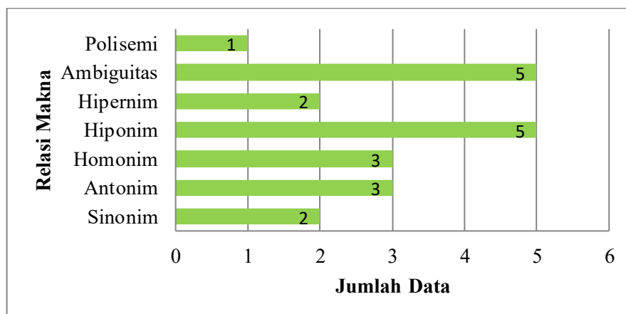
Grafik 2. Grafik Relasi Makna