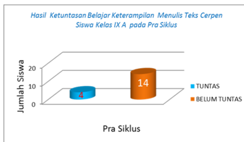
Gambar 1. Hasil Ketuntasan Siswa Belajar Menulis Narasi Pra Siklus

Merujuk pada data di gambar 1 di atas dapat dicatat bahwa dari total 18 siswa, hanya 4 yang tuntas, berarti presentase ketuntasan sebesar 22,22% (4 dari 18 siswa). Hal ini menunjukkan bahwa 14 siswa (77,78%) belum tuntas atau mencapai KKM. Untuk itu perlu perbaikan pembelajaran pada siklus berikutnya.