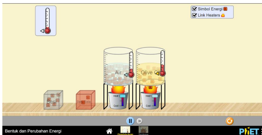
Gambar 2. Tampilan PhET Pokok Bahasan Suhu dan Kalor

PhET menyajikan pengguna dengan pengukuran energi termal yang terkait dengan suhu dan kalor. Pengguna dapat melakukan perhitungan sederhana terkait energi termal yang dibutuhkan atau dilepaskan selama proses pemanasan atau pendinginan suatu bahan.