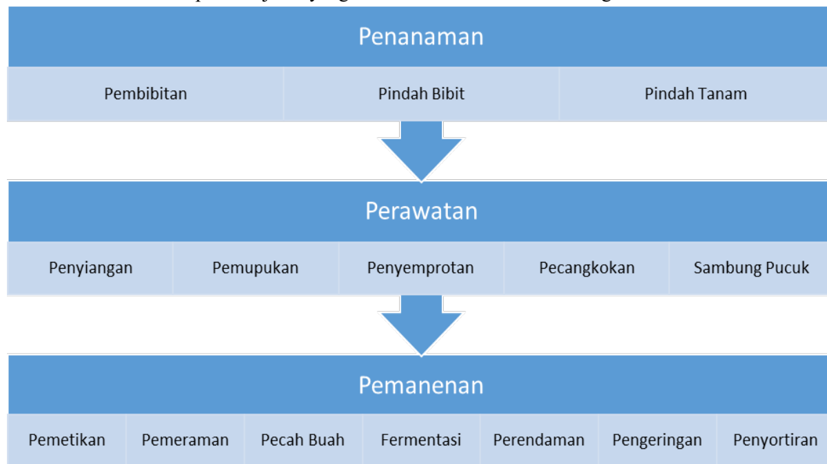
Gambar 2. Sistematika Pembelajaran

Pembelajaran dilaksanakan sesuai dengan rencana yang disepakati oleh tim, kepala sekolah, guru, dan siswa. Sistematika pembelajaran yang akan dilaksanakan adalah sebagai berikut.