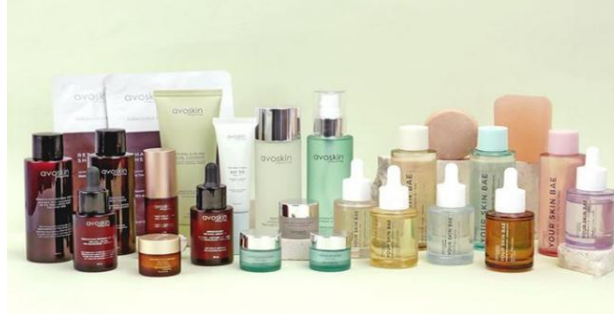
Gambar 2. Produk Avoskin

Serum avoskin merupakan perawatan kulit wajah yang terkenal dengan berbagai varian yang diformulasikan untuk mengatasi berbagai masalah kulit, seperti penuaan, jerawat, dan hiperpigmentasi. Serum avoskin menggunakan bahan-bahan alami yang ramah lingkungan seperti, extra aloe vera, tea tree, dan raspberry. Ini menjadikannya pilihan yang baik bagi mereka yang peduli terhadap kesehatan kulit wajah dan lingkungan.