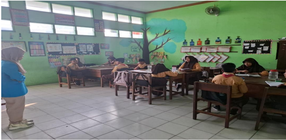
Gambar 4 :Pembelajaran dikelas.