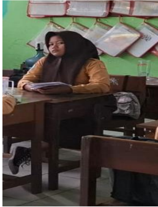
Gambar 2: Siswa Perempuan