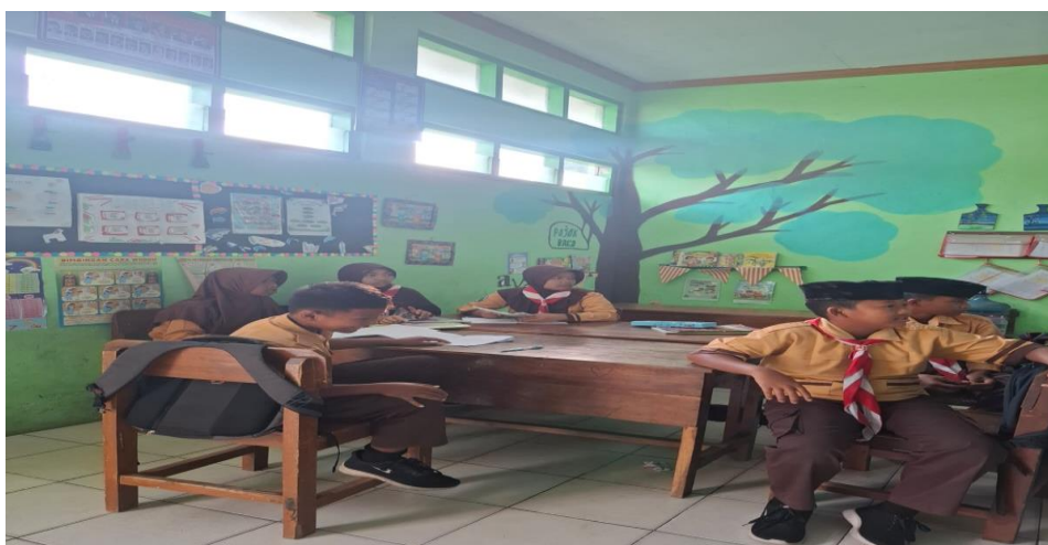
Gambar 6 :Suasana dikelas