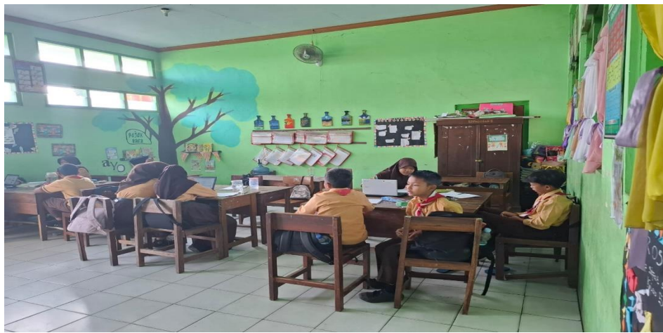
Gambar 3: Pembelajaran dikelas