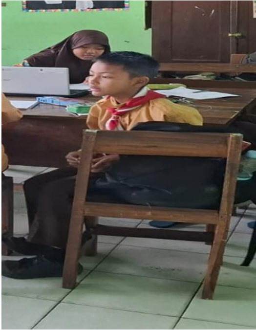
Gambar 1: Siswa Laki-laki