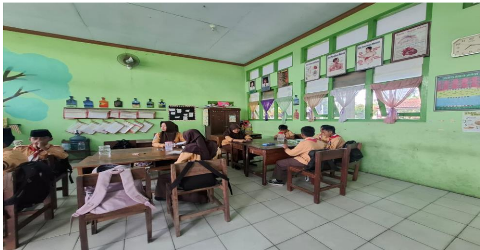
Gambar 5 : Suasana dikelas