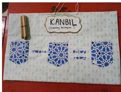
GAMBAR 1. Media kantong bilangan (kanbil)

Sudah saatnya guru-guru zaman modern seperti saat ini meninggalkan hal-hal yang bersifat kuno apalagi hanya melanjutkan cara-cara mengajar senior-senior guru kita terdahulu yang kurang memperhatikan akan media pembelajaran yang digunakan. Guru professional harus senantiasa mengupdate hal hal terbaru dan terkini yang referensinya sudah tersedia banyak di media sosial. Tinggal bagaimana kita pandai-pandai dalam mengaplikasikannya. Salah satu penggunaan media pembelajaran inovatif adalah penggunaan media kantong bilangan (kanbil) untuk materi penjumlahan dan pengurangan kelas 1. Berikut ini adalah gambar kantong bilangan (kanbil).