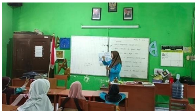
GAMBAR 3. Siswa sedang memperhatikan guru menjelaskan materi pelajaran dengan media kanbil

Selanjutnya pada siklus II terlihat saat proses pembelajaran guru sudah sangat baik menyampaikan materi sesuai dengan RPP dan menggunakan media kantong bilangan. Pada saat kegiatan pendahuluan, inti, dan penutupan siswa terlihat sangat antusias, bersemangat, aktif, mendengarkan dan memperhatikan materi yang disampaikan oleh guru, tidak ada yang jahil dan mengobrol, siswa lebih bersungguh-sungguh saat belajar. Sehingga dapat disimpulkan bahwa kegiatan pada siklus I dan siklus II dalam proses pembelajaran dengan menggunakan media kantong bilangan berhasil meningkat.