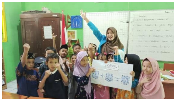
GAMBAR 4. Siswa didampingi guru mempresentasikan cara penggunaan kanbil