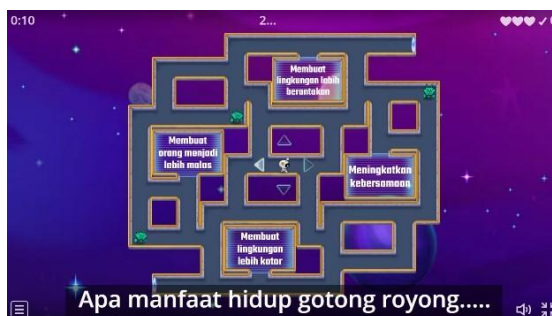
Gambar 2. Game Wordwall Bentuk Labirin Pada Siklus I

Berdasarkan tindakan pada siklus I dan siklus II dengan penggunaan media game online wordwall pada mata pelajaran PPKN dapat meningkatkan minat belajar siswa. Hal ini dibuktikan dengan hasil presentase dari siklus I ke siklus II yang mengalami peningkatan.