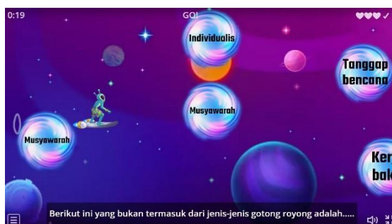
Gambar 4. Game Wordwall Bentuk Airplane Pada Siklus

Di siklus II memanfaatkan media yang sama yaitu wordwall hanya saja menggunakan fitur permainan yang berbeda. Dimana pada siklus II mengimplementasikan bentuk airplane atau pesawat. Tidak hanya fiturnya yang berbeda, namun juga pertanyaan yang ada pada game wordwall . Hal tersebut dilakukan agar siswa memiliki rasa tertantang sehingga menumbuhkan minat belajar siswa.