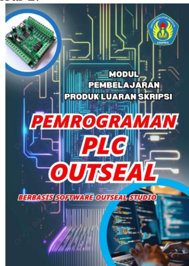
Gambar 2. Sampul modul pembelajaran PLC Outseal

Tahap design dilakukan perancangan modul berbasis proyek. Perancangan modul diawali dengan merancang sampul depan, urutan outline penulisan modul, dan menentukan konsep proyek pada tiap proyek yang ada. Tampilan desain modul dapat dilihat pada Gambar 1 dan Gambar 2.