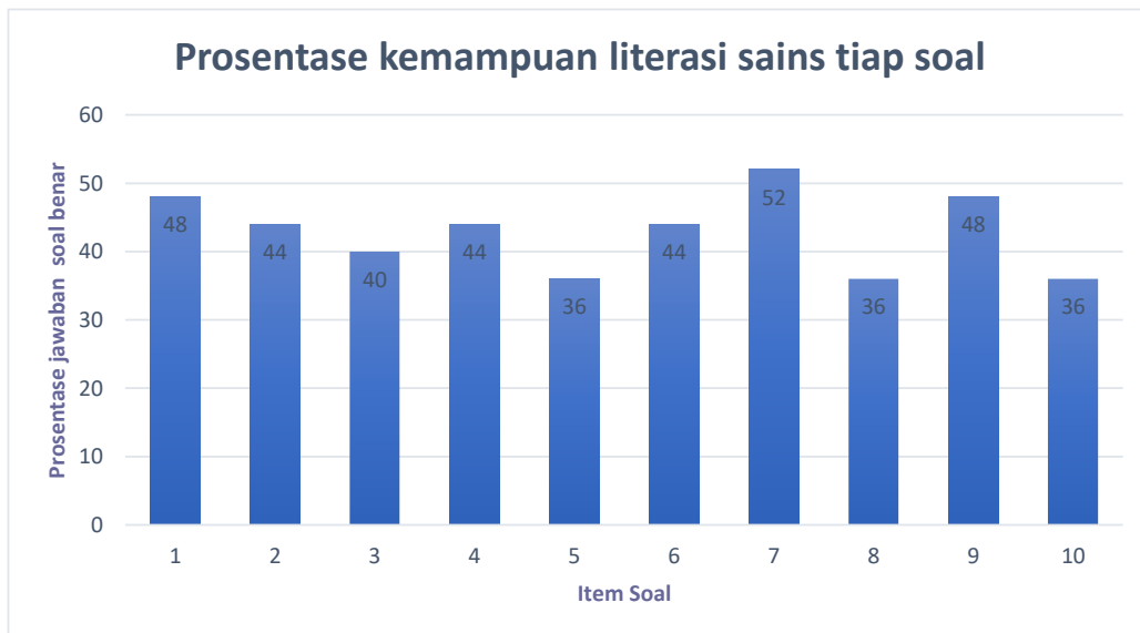
Gambar 2. Prosentase kemampuan literasi sains tiap soal

Berdasarkan grafik di atas dapat dilihat prosentase soal benar dari setiap item soal yang diberikan kepada mahasiswa. Untuk item soal nomor 1 prosentase mahasiswa yang menjawab benar sebesar 48% dengan indikator mengenali pertanyaan ilmiah dan mempunyai prosentase sama dengan item soal nomor 9, yaitu pada indikator mengkomunikasikan kesimpulan.