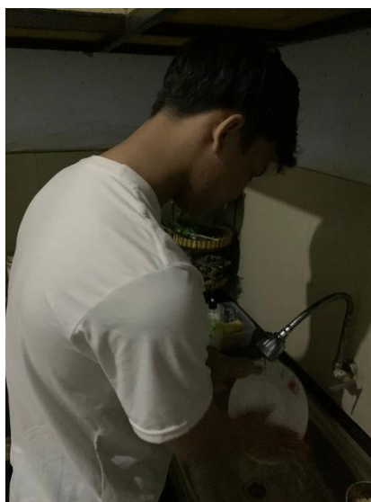
GAMBAR 2: Dokumentasi observasi keterlibatan anak dalam tugas rumah tangga.

Melibatkan anak dalam pekerjaan rumah tangga seperti mencuci piring memiliki dampak positif yang signifikan terhadap perkembangan karakter dan kesuksesan anak di masa depan. Studi Harvard yang berlangsung selama 75 tahun menunjukkan bahwa anak-anak yang terbiasa melakukan tugas rumah tangga sejak dini, termasuk mencuci piring, cenderung lebih sukses saat dewasa karena mereka mengembangkan etos kerja yang kuat, rasa tanggung jawab, dan disiplin sejak kecil