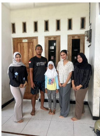
GAMBAR 4: Dokumentasi observasi keterlibatan anak dan ayahnya dalam tugas rumah tangga.

Temuan juga memperlihatkan bahwa komunikasi yang dilakukan oleh ayah tidak hanya bersifat instruktif, melainkan juga emosional dan edukatif. Ayah memberikan pujian atau komentar positif setiap kali anak menyelesaikan tugas, yang berdampak pada penguatan emosi dan kepercayaan diri anak. Interaksi semacam ini sangat penting karena menciptakan hubungan yang hangat dan kondusif antara anak dan orang tua, yang pada akhirnya memperkuat keterikatan emosional dan memperlancar proses belajar sosial anak (Elan et al., 2022).