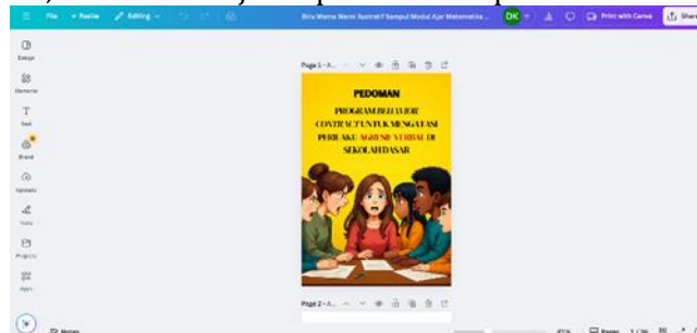
GAMBAR 1. Desain sampul buku pedoman

Berdasarkan hasil studi pendahuluan, peneliti mulai merancang dan mengembangkan buku pedoman program behavior contract . Tahapan ini mencakup penyusunan instrumen berupa lembar validasi dan angket respon, yang melibatkan ahli materi, ahli bahasa, tenaga pendidik, dan orang tua. Penyusunan buku mengadaptasi konsep buku KIA (Kesehatan Ibu dan Anak), sehingga menekankan aspek keterbacaan, keterlibatan orang tua, dan keberlanjutan pemantauan perilaku anak.