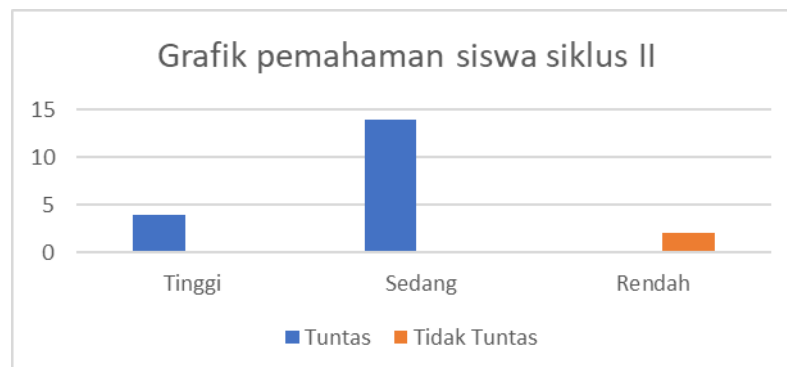
GAMBAR 1. Grafik pemahaman siswa siklus II

Perbaikan yang dilakukan pada siklus II telah disusun dengan lebih matang dan mempertimbangkan kekurangan pada siklus sebelumnya. Hasilnya pada siklus II menunjukkan bahwa 18 siswa telah tuntas dengan nilai di atas KKM. Sementara itu, 2 siswa yang mengalami peningkatan nilai dibanding siklus I meskipun belum memenuhi KKM dan tidak tuntas. Rata-rata pada siklus II ini sebesar 80.75 dengan presentase ketutasan yang diperoleh sebesar 90%. Berikut gambar grafis siklus II: