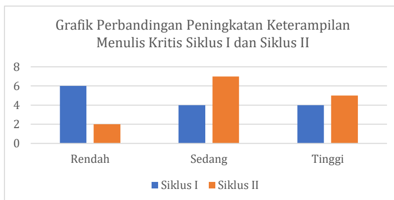
Gambar 3. Grafik Perbandingan Peningkatan Keterampilan Menulis Kritis Siklus I dan Siklus II

Berdasarkan tabel 1 dan gambar 3 diketahui bahwa pada siklus I, siswa yang mencapai ketuntasan sebanyak 8 siswa dan berada pada presentase angka 57,1%, belum memenuhi target minimal 80% ketuntasan. Keterampilan menulis kritis siswa mulai terlihat berkembang, terutama dalam menyusun informasi secara lebih terstruktur melalui aktivitas proyek. Namun, siswa dengan kemampuan awal rendah masih mengalami kesulitan dalam mengikuti proses pembelajaran.