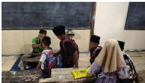
GAMBAR 2. Realisasi Penanaman Nilai-nilai karakter

“Dengan melalui pembelajaran Kitab Ta'limul Muta'alim ini, anak-anak tidak hanya diberikan ilmunya saja, namun juga dipraktikkan secara langsung, seperti misal adab terhadap guru, nah pada saat mau pulang anak-anak kan berpamitan dulu dengan ustadz maupun ustadzahnya. Disitu anak diajarkan bagaimana cara bersalaman dengan benar. Jika gurunya duduk, maka anak-anak bersalaman harus dengan cara ndodok ya kalau Bahasa jawnya. Ndodok itu berjalan dengan menggunakan tumpuan lutut. Jadi, anak-anak bersalaman dengan cara ndodok tadi dan berjalan agak jauh dari gurunya baru nanti boleh berdiri tegak. Nah itu juga salah satu penerapan nilai-nilai karakter, jadi anak tau bagaimana harus bersikap dengan orang yang lebih tua nantinya di lingkungan masyarakat. Selain itu juga, diajarkan adab makan, minum, sopan santun boso kepada guru dalam berkata maupun berbuat juga diajarkan dan dipraktikkan langsung di kesehariannya”. Hal ini dibuktikan dengan dokumentasi foto sebagai berikut: