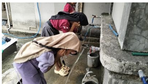
GAMBAR 3. Anak-anak spontan melaksanakan wudhu saat masuk waktu sholat ashur

Berdasarkan Hasil pengamatan peneliti di Madrasah tersebut, terlihat bahwa santri menunjukkan antusiasme tinggi saat berpartisipasi dalam pelaksanaan sholat ashur berjama'ah tersebut. Dari hal tersebut peneliti mengetahui bahwa anak-anak di Madrasah tersebut terbiasa dalam menjaga ketepatan terhadap waktu sekaligus lebih bertanggung jawab terhadap dirinya sendiri. Maka dari itu, peneliti menarik kesimpulan bahwa sholat berjama'ah mampu menginternalisasikan nilai-nilai karakter kepada anak. Hal ini persis dengan penyampaian dari salah satu Ustadzah di Madrasah tersebut, yakni: "Sholat berjama'ah disini itu sudah menjadi pembiasaan ya mbak, bahkan itu sudah dilaksanakan sejak lama. Jadi, setiap masuk waktu sholat Ashur, anak-anak itu langsung menghentikan permainannya. Apalagi kalo sudah mendengar kata "wudhu", maka anak-anak itu secara spontan akan menuju ke tempat wudhunya lalu setelah wudhu, salah satu yang laki-laki itu akan inisiatif sendiri untuk melakukan adzan. Setelah itu anak-anak juga akan melantunkan pujian secara Bersama-sama tanpa ada instruksi dari gurunya karena kan sudah terbiasa setiap harinya seperti itu". Data Hasil wawancara dan observasi ini semakin diperkuat dengan dokumentasi foto berikut ini: