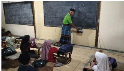
GAMBAR 1. Pembelajaran Kitab Ta'limul Muta'alim

Proses Internalisasi nilai-nilai karakter yang dilakukan melalui pembelajaran kitab Ta'limul Muta'alim ini, di mana anak-anak mempelajari materi keislaman seperti adab dan akhlak mulia. Kitab yang disusun oleh Syaikh Burhanuddin Al-Zarnuji ini mengandung ajaran tentang adab, tata krama dan nilai moral yang tinggi. Melalui pemahaman tersebut, anak-anak secara bertahap mampu menyerap dan mengamalkan nilai-nilai karakter dalam kitab tersebut sebagai pedoman berperilaku dalam kesehariannya. Hal ini sejalan dengan yang diungkapkan Kepala Madrasah Diniyah Diniyatul Islamiyah Sanggar Waringin yakni sebagai berikut: