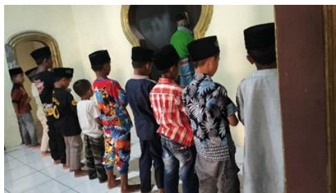
GAMBAR 4. Anak-anak melaksanakan Sholat Ashar dengan khidmat

Kegiatan Sholat Berjama'ah tersebut sebagai penginternalisasian terhadap nilai-nilai karakter ini diperkuat dengan penelitian dari Luluk Indah Sari dkk (Luluk Nur Indah Sari et al., 2022) bahwa Pelaksanaan sholat berjamaah di lingkungan Madrasah tidak hanya berperan dalam meningkatkan kesadaran anak akan pentingnya menjalankan ibadah sebagai kewajiban seorang Muslim, tetapi juga secara efektif menanamkan berbagai karakter positif dalam diri mereka. Melalui kebiasaan sholat bersama, anak belajar untuk disiplin dalam mengatur waktu, bertanggung jawab terhadap tugas-tugas keagamaan, serta membiasakan diri untuk jujur dan konsisten dalam setiap tindakan. Selain itu, interaksi yang terjalin selama sholat berjamaah mendorong terciptanya rasa saling menghormati, baik kepada guru maupun sesama teman, sehingga terbentuk lingkungan yang harmonis dan penuh toleransi.