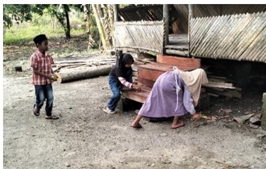
GAMBAR 5. Kegiatan Pembiasaan bersih-bersih di Madrasah

Meskipun karakter anak beragam, pelaksanaan pembiasaan secara bersama-sama mampu membangkitkan motivasi Bersama dalam penguatan Pendidikan karakter (Marzuqi, 2022). Sebagaimana yang disampaikan oleh salah satu anak sebagai berikut: "Sebener e awal-awal itu terpaksa Mbak dan pas awal itu kalau ada kegiatan bersih-bersih itu aku menghindar ke kantin. Tapi akhirnya aku sadar terus ikut bersih-bersih dan ternyata kalo di lakuin bareng-bareng itu seru". Hasil wawancara ini diperkuat lagi dengan penyampaian dari kepala Madrasah, yaitu sebagai berikut: "Jadi anak-anak itu sebelum melaksanakan sholat ashar berjamaah itu harus membersihkan halaman Madrasah maupun Madrasahnyanya terlebih dahulu agar nanti saat melaksanakan kegiatan belajarnya nyaman dengan keadaan madrasah yang bersih. Dan itu dilaksanakan secara rutin setiap hari. Nah, dengan kegiatan itu kan akhirnya nanti anak-anak bisa menerapkan di lingkungan masyarakat jika nantinya ada kegiatan kerja bakti di desa". Hasil wawancara tersebut diperkuat dengan adanya dokumentasi foto dari peneliti berikut ini: