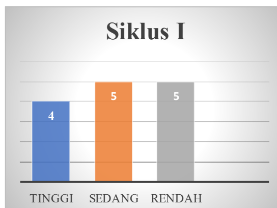
GAMBAR 1. Grafik hasil ketuntasan siswa siklus I

Kemampuan membaca pemahaman pada siklus I di ukur dengan hasil tes soal dengan menggunakan model pembelajaran PQ4R berbantuan media e-book , berikut adalah hasil keterampilan membaca pemahaman pada siswa kelas IV.