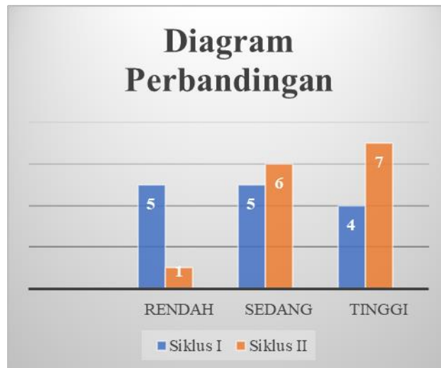
GAMBAR3. Grafik perbandingan siklus I dan siklus II

Secara keseluruhan, penerapan model PQ4R berbantuan e-book terbukti efektif meningkatkan kemampuan membaca pemahaman siswa. Hasil belajar siswa meningkat tajam dari 64,29% pada siklus I menjadi 92,86% pada siklus II. Peningkatan ini dipengaruhi oleh perbaikan strategi pembelajaran serta motivasi belajar siswa, karena keberhasilan belajar tidak hanya ditentukan oleh metode yang digunakan guru, tetapi juga oleh kemauan belajar dari dalam diri siswa.