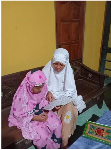
GAMBAR 2. Mengaji

mengulang aktivitas tetapi melibatkan pendekatan emosional berupa dukungan dan apresiasi. Sehingga anak lebih bersemangat untuk melakukan ibadah dengan konsisten.