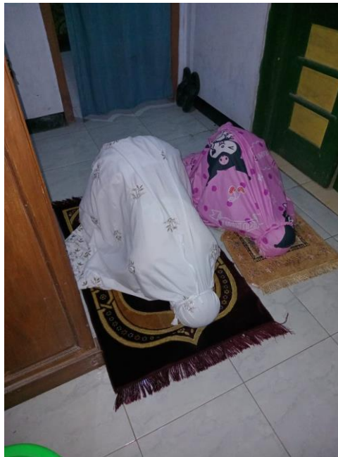
GAMBAR 1. Sholat

Begitupun dengan mengaji. Ibu Yayuk konsisten melakukan mengaji setiap hari. Anak secara tidak langsung lama-kelamaan akan mengikuti mengaji juga. Sama halnya dengan kejujuran, saling tolong menolong, berkata baik. Itu semua jika orang tua melakukannya dengan baik maka anak pun akan mengikutinya dalam kesehariannya. Karena lama kelamaan anak akan paham tentang ajaran-ajaran agama yang mencerminkan nilai religius yaitu takut kepada tuhan. Dalam keseharian Ibu Yayuk juga memutarakan murotal Al-Quran dirumah. Ini menunjukkan bahwa Ibu Yayuk menciptakan suasana religi di dalam rumah. Anak yang sering mendengarkan ayat-ayat Al-Quran akan merasa lebih dekat dengan nilai-nilai religius. Ibu Yayuk juga menunjukkan contoh doa harian kepada anak seperti doa sebelum makan, sebelum tidur, naik kendaraan dllnya. Orang tua yang secara tidak langsung memberikan contoh perilaku ibadah dalam keseharian dapat menanamkan nilai-nilai religius kepada anak. Dengan metode keteladanan ini tidak hanya kata-kata tetapi dapat menciptakan perilaku nyata atau contoh nyata bagi anak yang dapat ditiru oleh anak setiap hari.