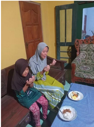
Gambar 3. Membaca doa makan