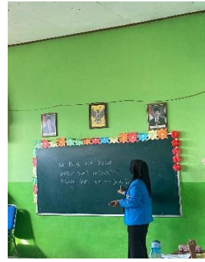
Gambar 4. Memberi contoh soal