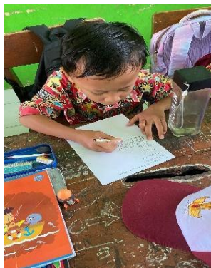
Gambar 1. Anak Bisa Menulis

Dalam gambar 1 menjelaskan seorang siswa kelas 1 sudah bisa menulis dengan cukup baik. Sedangkan pada gambar 2 menjelaskan hasil dari tulisan anak kelas 1 sudah bisa dibaca dengan baik.