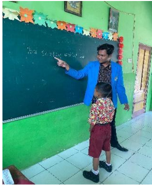
Gambar 3. Mengajar mengeja