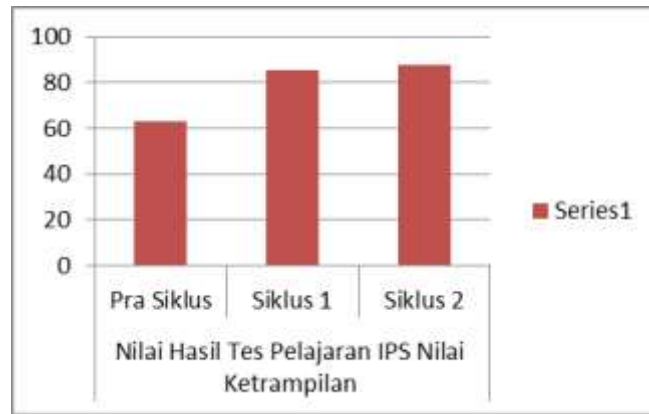
Gambar 2. Nilai Pengetahuan Pelajaran IPS Tiap Siklus

Dari pembahasan di atas menunjukkan bahwa adanya peningkatan rata-rata hasil belajar siswa yang signifikan dari prasiklus ke siklus I, dan dari siklus I ke siklus II. Hal itu dapat diartikan tindakan perbaikan pembelajaran yang peneliti lakukan dapat meningkatkan kualitas belajar siswa pada pelajaran IPS dengan Penerapan Digital Learning di kelas IV SD Negeri Pengkol Kecamatan Kauma Kabupaten Ponorogo.