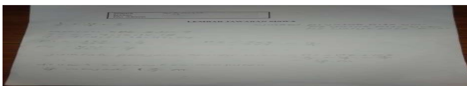
Gambar 1.6 jawaban S3

Proses penelitian yang digunakan oleh peneliti yaitu dengan menggunakan tes tertulis dan wawancara guna mendapatkan hasil yang valid atau benar dalam mendeskripsikan Learning Obstacles pada masalah pecahan campuran soal cerita yang muncul pada S3.