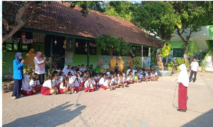
Gambar 3. Peserta Didik Sedang Bercerita di Depan

Setelah mengeksplorasi dan mendalami isi bacaan, peserta didik diwajibkan untuk membuat pertanyaan serta jawaban terkait dengan teks yang telah dibaca. Selain itu mereka akan dituntut untuk membawakan cerita mereka di depan saat pembiasaan literasi berlangsung. Pembiasaan literasi ini merupakan salah satu program peningkatan literasi dari Kampus Mengajar Angkatan 6, yang mana pelaksanaannya sendiri dilakukan setiap hari Selasa dan Kamis pagi pukul 07.00 di lapangan sekolah. Pertanyaan yang telah mereka buat nantinya akan diberikan kepada teman-teman mereka setelah selesai bercerita. Peserta didik yang paling banyak menjawab pertanyaan dengan benar akan mendapatkan reward berupa buku tulis maupun buku gambar.