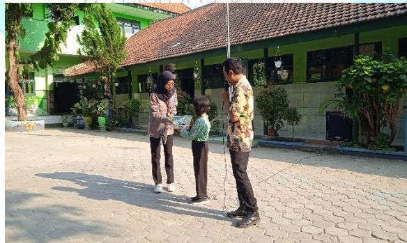
Gambar 4. Proses Pemberian Reward Kepada Peserta Didik