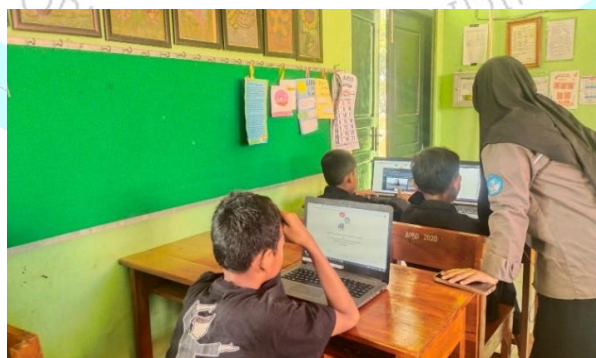
Gambar 1. Menjelaskan Penggunaan Platform Let's Read Asia

Dalam Aksi Gerakan Literasi ini penerapan Metode Reading Guide diperluas dengan tujuan menarik perhatian peserta. Langkah awal penerapan Metode Reading Guide tenaga pendidik merancang bacaan serta pertanyaan yang akan ditelaah oleh peserta didik. Pada tahap ini dilakukan literasi digital melalui Platform Let's Read Asia. Dalam Platform ini terdapat berbagai macam kategori bacaan yang tersedia dalam beberapa bahasa, melalui platform tersebut peserta didik bebas memilih bacaan yang akan dieksplorasi lebih jauh.