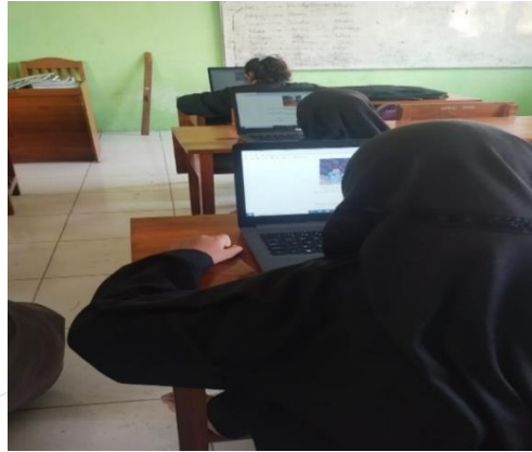
Gambar 2. Peserta Didik Sedang Melakukan Proses Literasi Digital

Setelah mengeksplorasi dan mendalami isi bacaan, peserta didik diwajibkan untuk membuat pertanyaan serta jawaban terkait dengan teks yang telah dibaca. Selain itu mereka akan dituntut untuk membawakan cerita mereka di depan saat pembiasaan literasi berlangsung. Pembiasaan literasi ini merupakan salah satu program peningkatan literasi dari Kampus Mengajar Angkatan 6, yang mana pelaksanaannya sendiri dilakukan setiap hari Selasa dan Kamis pagi pukul 07.00 di lapangan sekolah. Pertanyaan yang telah mereka buat nantinya akan diberikan kepada teman-teman mereka setelah selesai bercerita. Peserta didik yang paling banyak menjawab pertanyaan dengan benar akan mendapatkan reward berupa buku tulis maupun buku gambar.